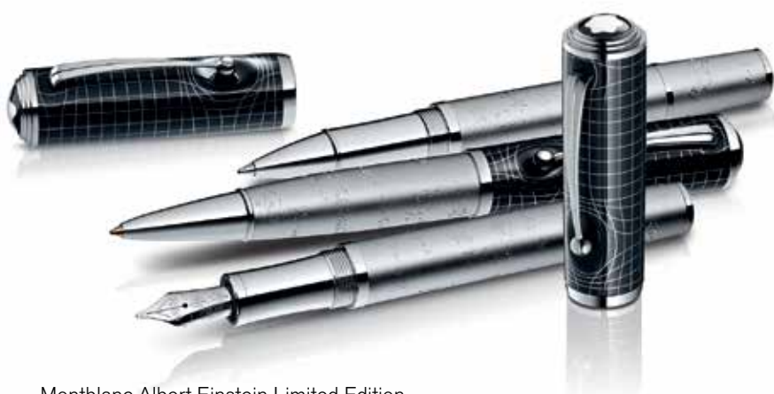
Montblanc Albert Einstein Limited Edition