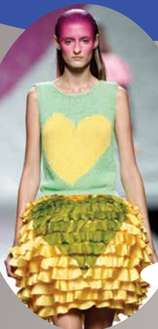
Agatha Ruiz de la Prada