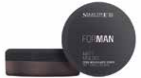
MATT MOLDER FORMEN