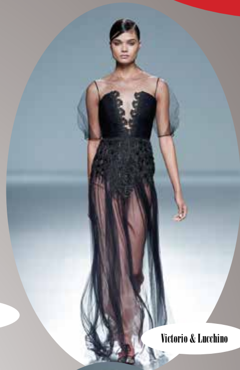
Victorio & Lucchino